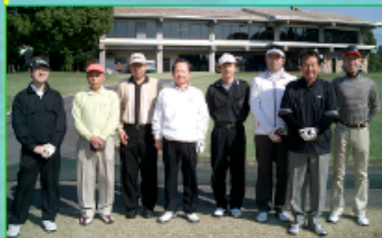
★快晴に恵まれ、心身共に“Nice Shot”!