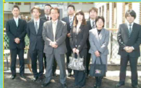
★今年度もこのメンバーで盛り上げます!