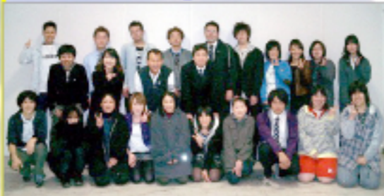
★両模様にも関わらず、多くの方々が集まって下さり、活気溢れる大会となりました。