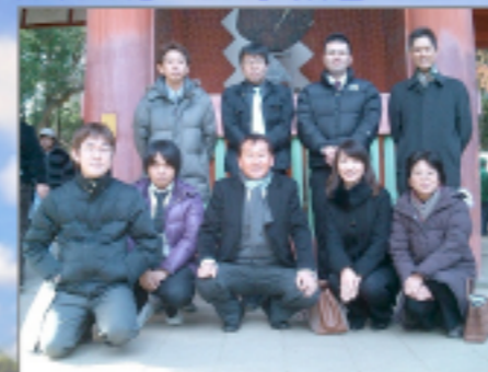
★気持ち晴れやかに「新年」を迎えました。