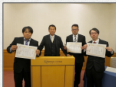
受賞の皆さん、誠におめでとうございます(´0´)!