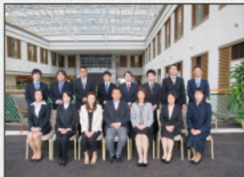
4/1(土) 11:00 鹿高セントラルホテルにて