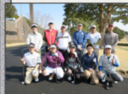
3/28(火) ノースショア CCにて